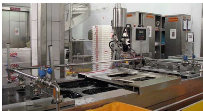
Man kan även, som här, låta en och samma Fillflex Sequence fylla på marinad både före och efter det att köttet läggs i. Arbetstakten blir då något långsammare, men även denna lösning ger alla fördelar med minskat spill, minskad marinadförbrukning och högre produktkvalitet.