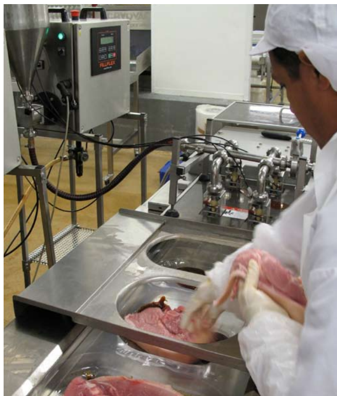
Först doserar den ena av de båda Fillflex Sequence en del av marinaden i det tomma träget. Därefter läggs det rena köttet i för hand.

Investeringen i Fillflex Sequence var intjänad på mindre än ett år enbart på minskad förbrukning av marinad.