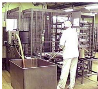
Fillflex suger pastejsmeten direkt ur skänkvagnen.