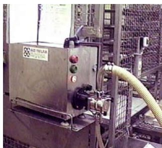
Fillflex Compact har små ytermått och är mycket lättplacerad.