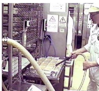
Maskinen startar automatiskt efter inställd paustid mellan formarna.

Maskinen har använts dagligen i flera år och gjort fyllningsarbetet mycket effektivt.