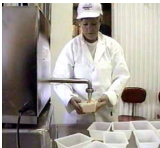
Fyllningen startas med en fotpedal. Fillflex stoppar fyllningen vid rätt mängd.