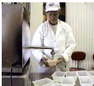
Fyllningen startas med en fotpedal. Fillflex stoppar fyllningen vid rätt mängd.