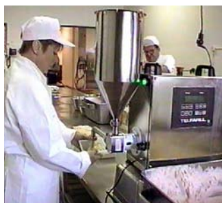
Laxpaten fylls på i tratten – enkelt, hygieniskt och lättdiskat. (Även detta arbete kan automatiseras med Fillflex Matarpumpar, om kunden så önskar.)