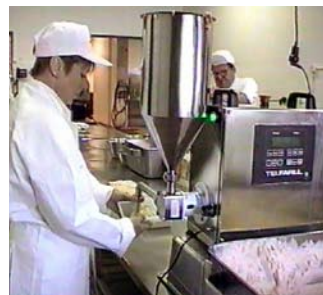
Laxpaten fylls på i tratten – enkelt, hygieniskt och lättdiskat. (Även detta arbete kan automatiseras med Fillflex Matarpumpar, om kunden så önskar.)