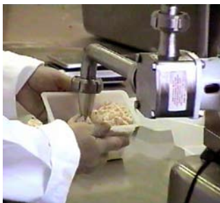
Impellerpumpen är skonsam mot produkten.

Produktionen har fördubblats under ca två år. Trots att Fillflex Compact är så liten, kan produktionen öka ytterligare med samma utrustning.